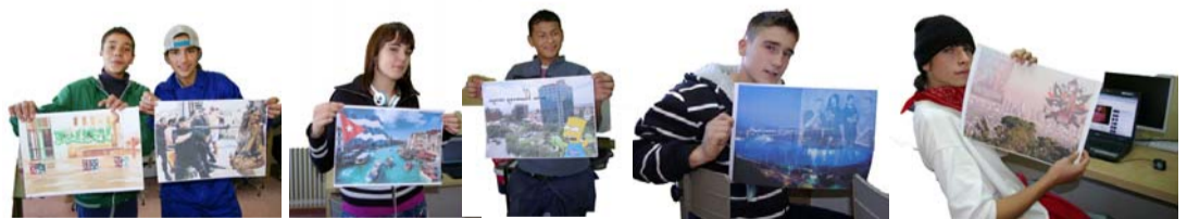
Algunos alumnos de Pioneros con sus creaciones.